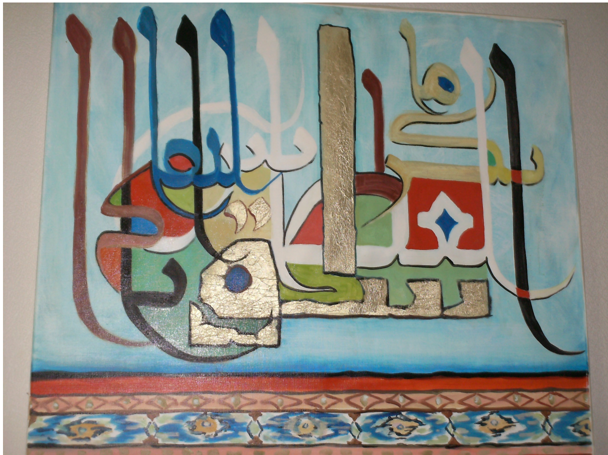
Id YAKOUBI, peintre